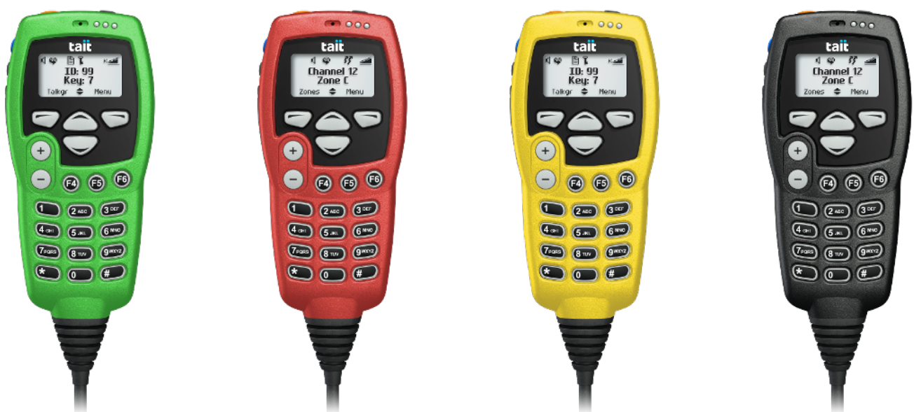
Cabeças de controle portáteis