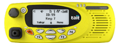
Amplas cabeças de controle